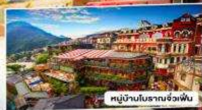
หมู่บ้านโบราณจั๋วเฟิ่น