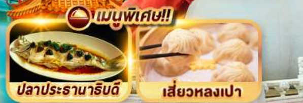
ปลาประธาราธิบดี