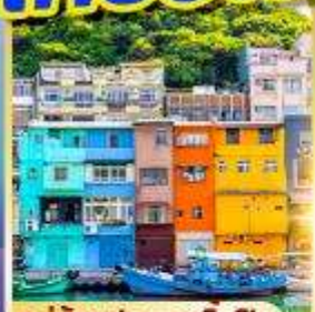
หมู่บ้านประมงเงินปิง

พักซีเหมินติง 2 คืน เที่ยวเต็ม!! ไม่มีวันอิสระ