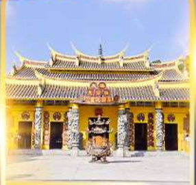
วัดซอพรเทพเจ้า