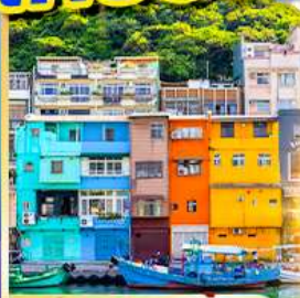
หมู่บ้านประมงเจินปิง

พักซีเหมินติง 2 คืน เที่ยวเต็ม!! ไม่มีวันอิสระ