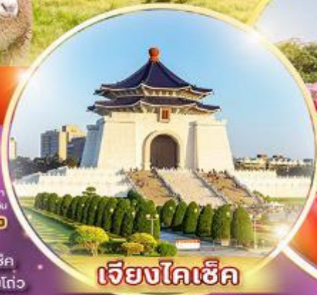
เจียงโคเฮ็ค

ชมสวนดอกไม้เมืองเซ่อ ฟาร์มแกะ-สิงจิง อู๋สุรณัฐสถานเจียงโคเฮ็ค ส่องเรือทะเลสาบสุริยันจันทรา วัดพระถังซำจั๋ง ป้อมน้ำพุร้อนเป่ย์ถั่ว วัดหลงชาน แวะถ่ายรูปตึกไทเป 101 ซีเหมินติง ไถจงโมถ์มาร์เกิ้ล พิเศษ...เมฆหมอกน้ำจืดจรรพดี เมฆสีขาวหลงเป่า เมฆชาบูบุฟเฟ่ต์สโตร์ไต้หวัน