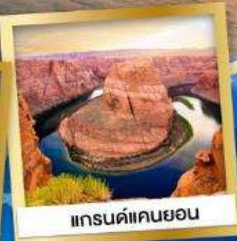
แกรนด์แคนยอน