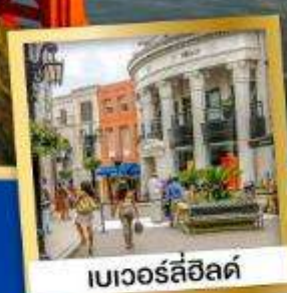
เบเวอร์ลี่ฮิลล์