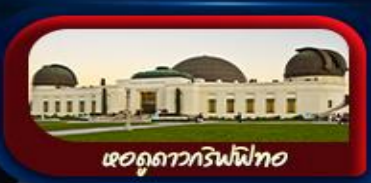
หอดูดาวกริฟฟิท

การันตี 10 ท่านออกเดินทาง พร้อมหัวหน้าทัวร์คนไทย