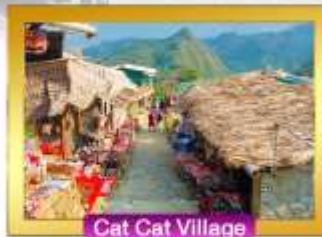
Cat Cat Village