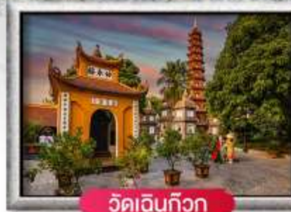
วัดเอนกวิวก