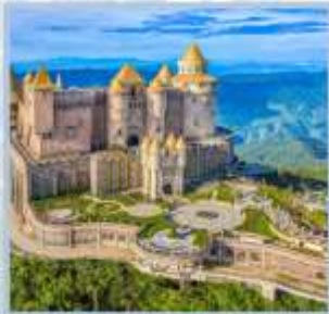
ปราสาทจินตรา