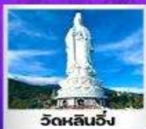
วัดหลินฮิง