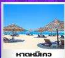
หาดหมิเคว