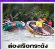
ล่องเรือกระดัง

วัดนามเซิน • บานาฮิลล์ • ซานต้า มารีน่า คาเฟ่ • สะพานแห่งความรัก - สะพานมังกร สวนมหิตธรรม • สวนเอเปค • ร้านกาแฟ บาร์มมิช • ห้างวินคอม • โบสถ์สีชมพู • ตลาดดาว