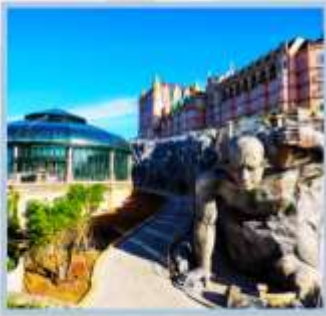
โซน Eclipse Square