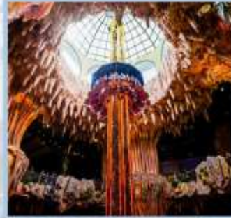
สวนสนุก Fantasy Park