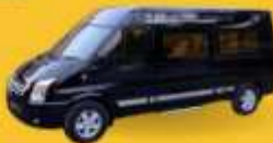
VAN (7-8 ท่าน)