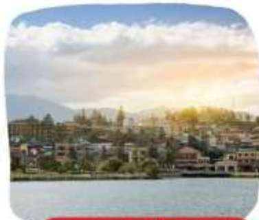
ทะเลสาบเมืองซาปา