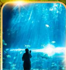
อควาเรียม