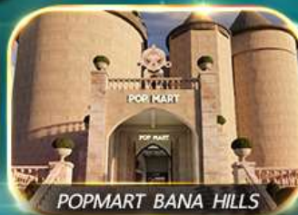
POPMART BANA HILLS

สัมพัสความงามหมู่บ้านฝรั่งเศสที่บานาฮิลล์ ซอมีนัง POPMART