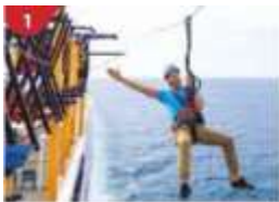
1 Ropes Course & Zipline Feel the thrill of gliding above the ocean on a 35-metre zipline.

ถ้าท่านประสงค์จะถือกระเป๋าเดินทางลงด้วยตัวเองไม่จำเป็นต้องวางไว้ที่หน้าห้องพัก