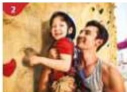
2 Rock Climbing Wall Challenge yourself on our mountainous rock climbing wall.