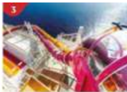
3 Waterslide Park Get drenched in fun on one of our six different waterslides.