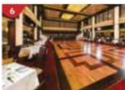
6 Dream Dining Room Savour a wide variety of Asian and international cuisine.