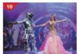
10 Zodiac Theatre Enjoy live production shows from the acclaimed award-winning entertainment team.

**เรือจะมีใบแจ้งสถานที่และเวลาที่ห้องพักของท่านเพื่อนให้ท่านรับหนังสือเดินทางคืน