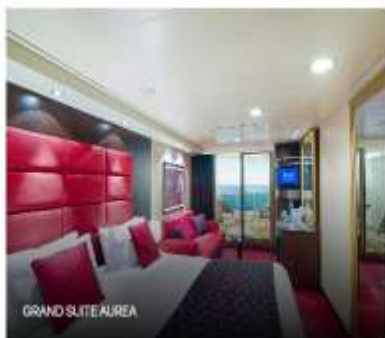
GRAND SUITE AIREA