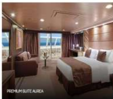
PREMIUM SUITE AIREA