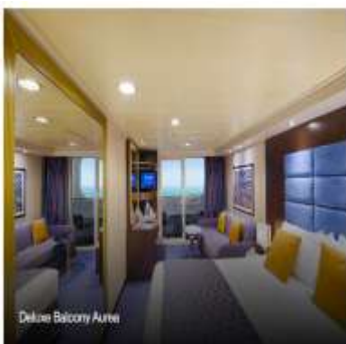
Deluxe Balcony Airea