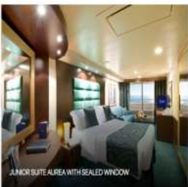
JUNIOR SUITE AIREA WITH SEALED WINDOW