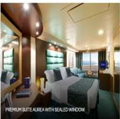
PREMIUM SUITE AIREA WITH SEALED WINDOW