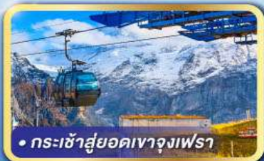
• กระเช้าสู่ยอดเขาจุงเฟรา